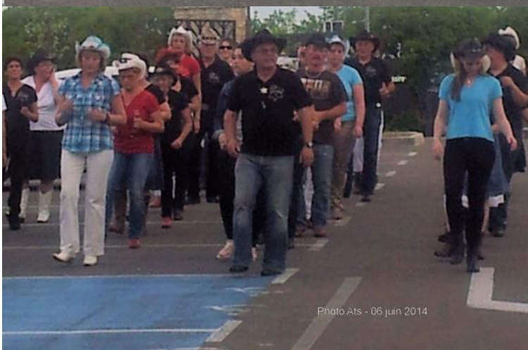
06 juin 2014