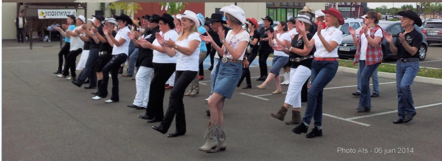
06 juin 2014