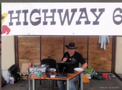
06 juin 2014