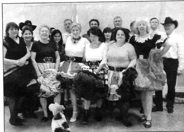
Le groupe de square dance de l'American Club Rambouillet 78.

• American Club Rambouillet 78 , tel. : 06 84 30 89 30.